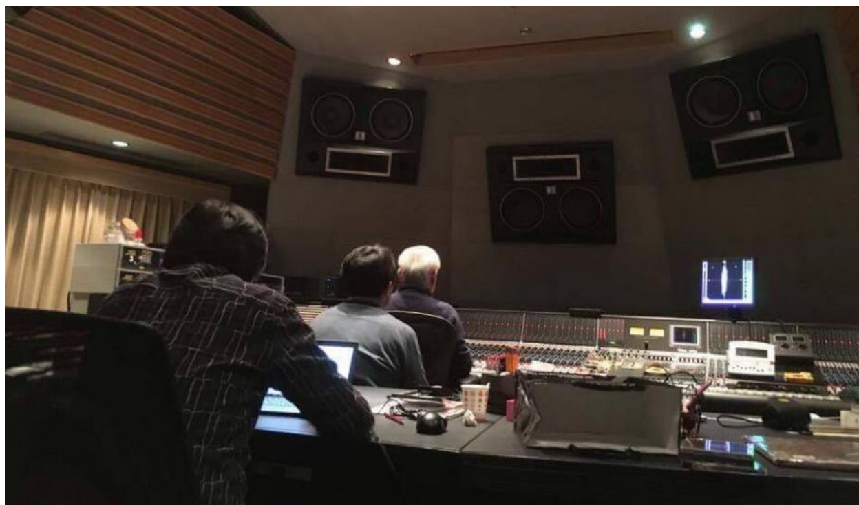
Mastering session of Lotus album in Sony Japan Studio

اما این روش استدلال بطور خاص روشی هوشمند نیست - اگر همین استدلال را برای فیلم های قدیمی به کار ببرید آنگاه احتمالاً نتیجه میگیرید که این فیلم ها باید فقط با پروژکتورهای قدیمی ئی که برای نوار این نوع از فیلم ها ساخته شده بودند و فیلم های اصلی روی آنها ضبط می شده نمایش داده شوند. صفحه های موسیقی قدیمی نیز فقط باید بوسیله تجهیزات قدیمی و بلندگوهایی که در همان دوران استفاده می شدند پخش شوند و الی آخر... اینکار نتیجه ای جز بیشتر کردن خطاهایی که در هنگام ضبط موسیقی در استودیو ایجاد شده اند نخواهد داشت. ما اینک فهمیده ایم - البته خارج از دنیای "عتیقه بازها" - که این راه بن بست است و واضح است که ما از سمت خود می بایست تمام تلاش خود را صرف کنیم تا حداکثر کیفیت و اطلاعاتی که تهیه کننده گان بیرون داده اند را به دست آوریم. استفاده از کابل های یکسان با آنچه در استودیوها به کار می روند می تواند به افزایش مجدد و تکرار همان خطاهایی منجر شود که در هنگام ضبط نیز به اثر تحمیل شده اند، و همچنان توقع اینست که سیستم صوتی با حداقل میزان اعوجاج (دیستورشن) ممکن صدا را بازتولید کند.